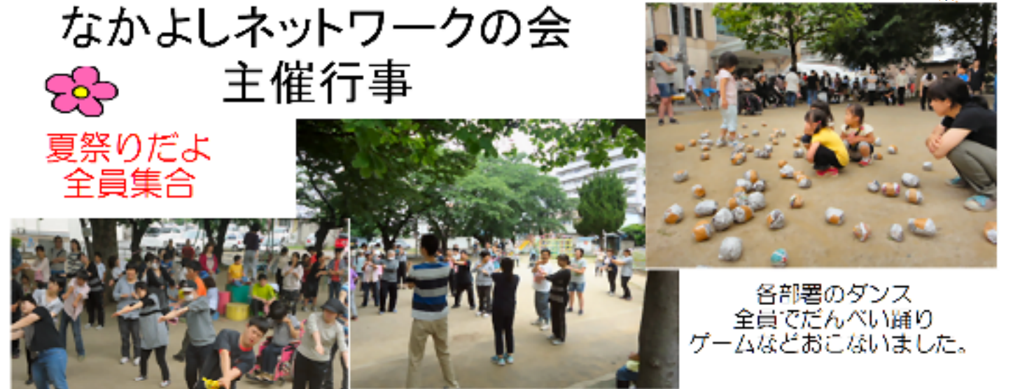
各部署のダンス 全員でだんべい踊り ゲームなどおこないました。